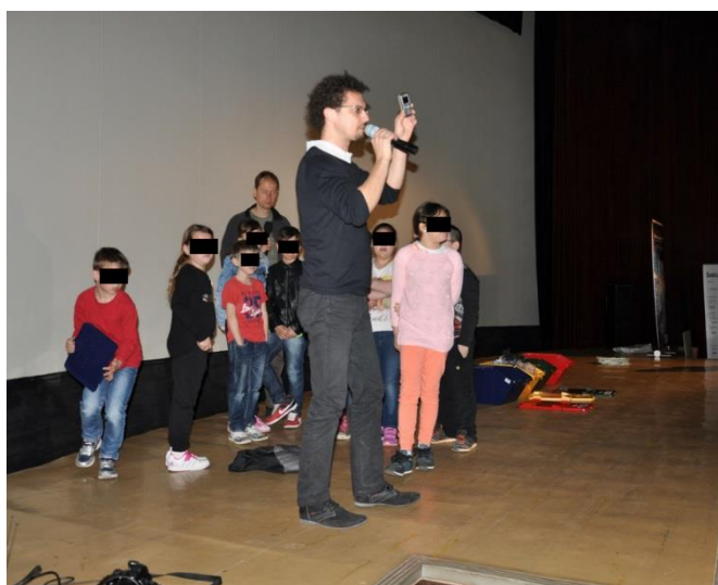
Obr. 1: Program NATUR-PACK v rámci Junior festivalu na Ekotopfilme v meste Hlohovec 20. 10. 2017

Doplňujúce informácie: http://bit.ly/2ulwcTE , http://bit.ly/2N6pGb1 , ako aj na www.ekotopfilm.sk .