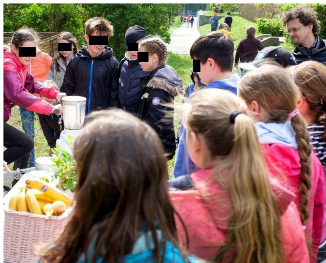
Obr.4: NATUR-PACK na Dni Zelených škôl v bratislavskej Karlovej Vsi

V roku 2017 silne zarezonovala aktivita Dni Zelených škôl, v rámci ktorej sa po celom Slovensku uskutočnilo 130 podujatí na 58 školách zapojených do programu Zelená škola.