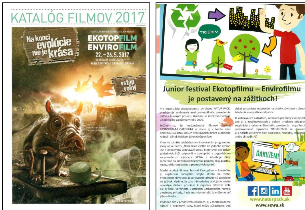
Obr. 12: Katalóg filmov, sprievodný materiál k filmovému festivalu Ekotopfilm/Envirofilm, ročník 2017/2018

Intenzívnu lokálnu a regionálnu medializáciu aktivít NATUR-PACKu zabezpečoval aj putovný filmový festival Ekotopfilm – Envirofilm (lokálne médiá, sociálne siete). V každom meste a pri každom vystúpení sa distribuuujú tlačené materiály Festivalové noviny a Katalóg filmov s príspevkami NATUR-PACKu o vzdelávacom programe.