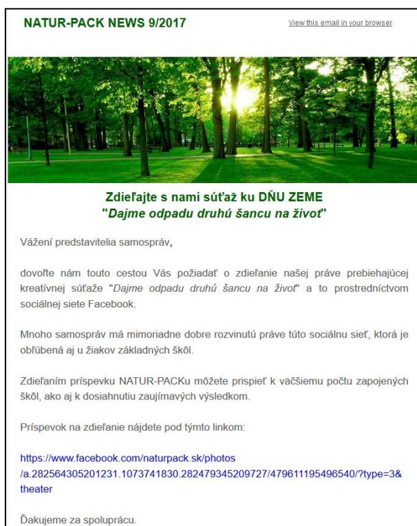
Obr. 8: Vizuál hromadného e-mailu samosprávam

Komunikáciu formou hromadných emailov NATUR-PACK využíva aj pri oboznamovaní škôl a samospráv o vyhlásených súťažiach (napr. ku Dňu Zeme). Dňa 23. 9. 2016 vyhlásil NATUR-PACK výtvarnú súťaž o najkrajší motív vianočnej pohľadnice. Do súťaže sa mohli zapojiť všetky školy partnerských samospráv.