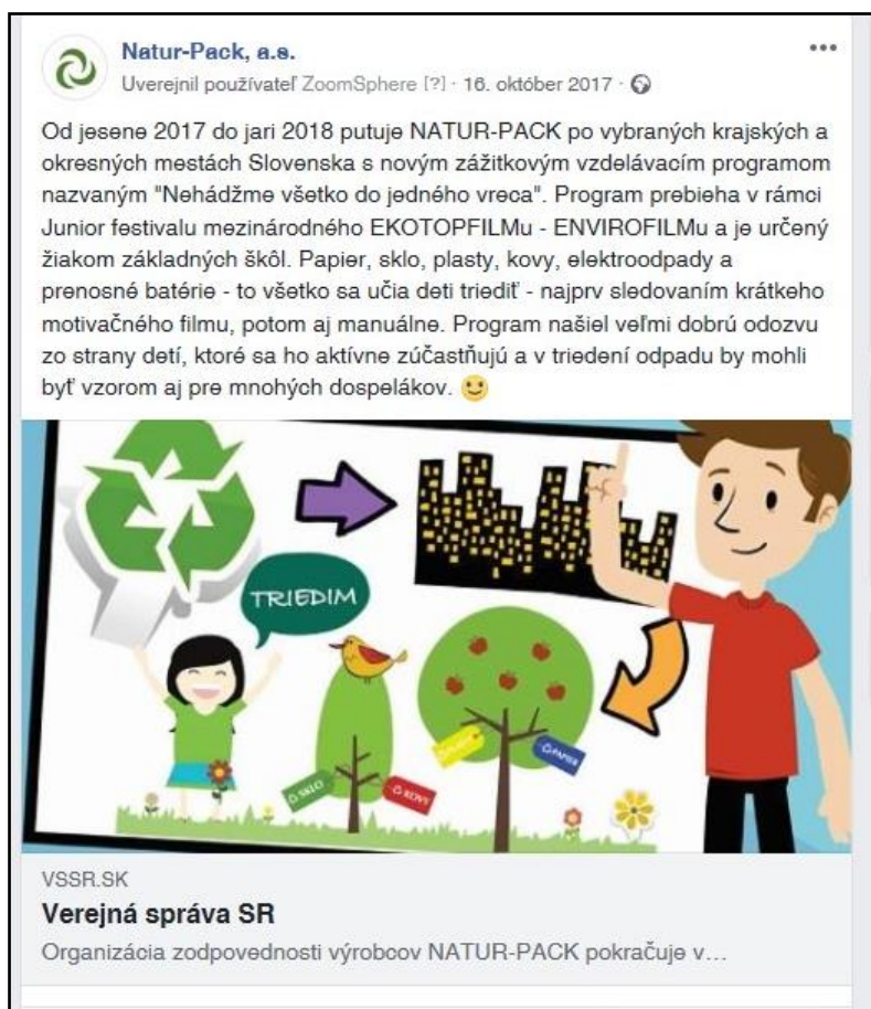
Obr. 6: Ukážka jedného z príspevkov na sociálnej sieti Facebook venovaného aj téme elektroodpadov