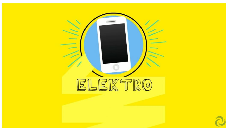
6. diel seriálu Nehádzme všetko do jedného vreca - Elektroodpady

V priebehu roka 2017 bol seriál v spolupráci s OZV SEWA rozšírený o 6. diel – Elektroodpady a 7. diel Batérie a akumulátory a k zvukovej podobe pribudla aj vizualizácia v podobe animovaného seriálu. Ten sa stal základom zážitkového programu aj pre filmový festival Ekotopfilm – Envirofilm.