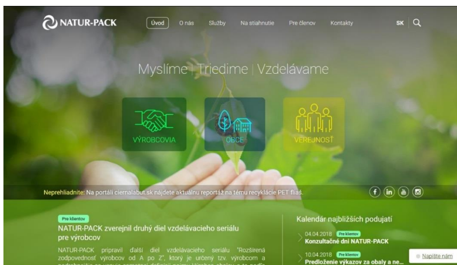
Obr. 13: Vizuál novej webovej stránky www.naturpack.sk , ktorej príprava začala v druhej polovici roka 2017