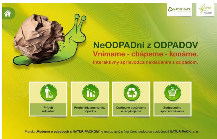
Obr. 3: Vizuál výučbového softvéru „NeODPADni z ODPADOV“

NATUR-PACK sa snaží popularizovať softvér „ NeODPADni z ODPADOV “ prostredníctvom školení pre pedagógov, ako aj prostredníctvom ďalších aktivít (napr. Ekotopfilm – Envirofilm, Obecné noviny, Odpadové hospodárstvo a ďalšie médiá a sociálne siete).