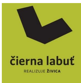
Obr. 11: Vizuál loga portálu Čierna labuť