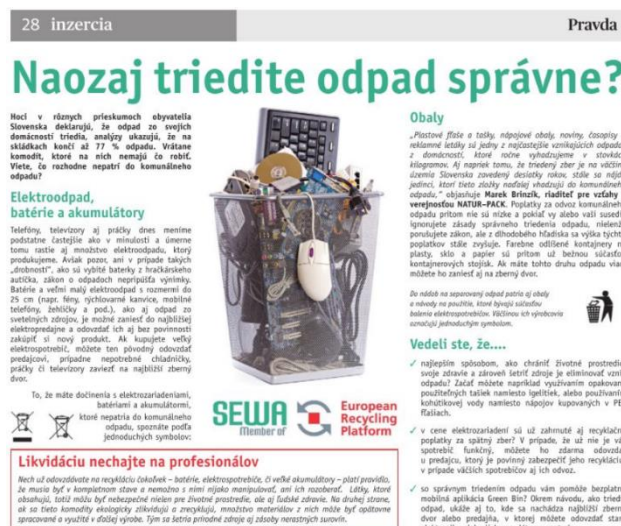
Obr. 10: Časť vizuálu informačného článku v denníku Pravda, apríl 2017

V apríli 2017 (12. 4. 2017) sme participovali na zverejnení článku v spolupráci s OZV SEWA, a to na tému správneho triedenia odpadov.